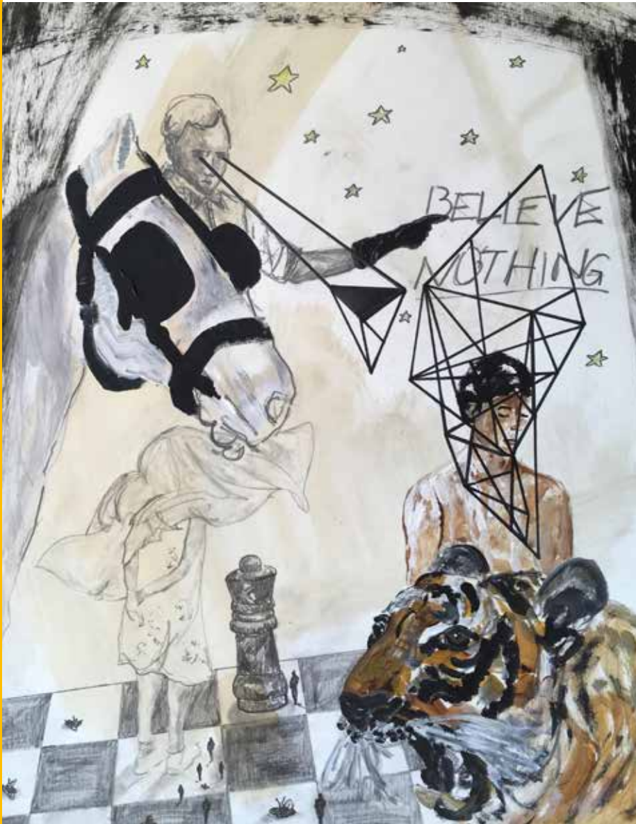
Klaus Ludwig Kerstinger „Believe Nothing“ Mixed Media auf Papier, 50x40 cm

www.kerstinger.com www.mufuku.weibern.at