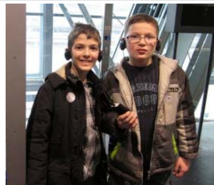
Linz - VOEST - Stahlwelt