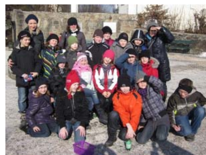
Linz - Schloss