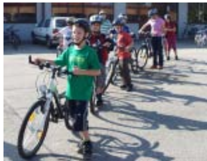
Mit Helm gut ausgerüstet für das Geschicklichkeitsfahren

Die AUVA ermöglichte diese Aktion, bei der alle Kinder sowohl Geschicklichkeit am Rad üben konnten, als auch über das sichere Verhalten im Straßenverkehr informiert wurden. Mit einer Urkunde belohnt wurde der Vormittag abgerundet.