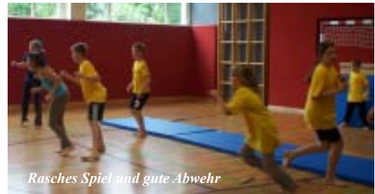
Rasches Spiel und gute Abwehr

Am 29. Juni wurde in unserer Schule der 4. Mattenhandball-Cup ausgetragen. Insgesamt 18 Gruppen aus 8 Schulen des Bezirkes stellten sich dem Wettkampf. Siegerschulen waren die VS Pram und die VS Gallspach; die Weiberner Kinder erreichten einen hervorragenden 5. Platz.