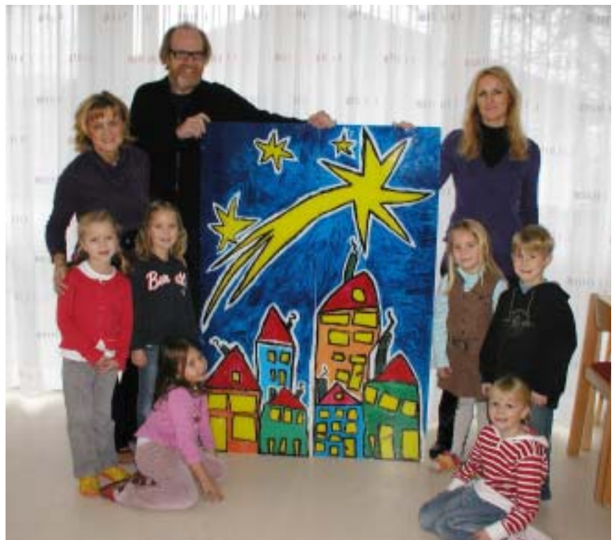
Weiberner Kindergartenkinder gestalten ein Adventkalenderfenster - sh. Seite 6.