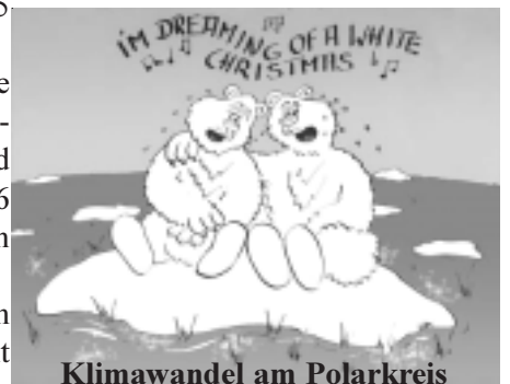
Klimawandel am Polarkreis

Die BündnispartnerInnen haben sich zum Ziel gesetzt, Schritte zum Erhalt der Erdatmosphäre zu unternehmen.