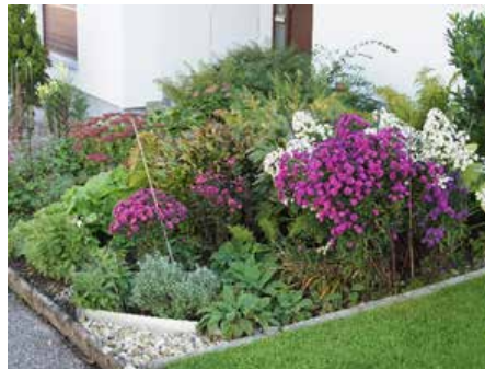
Abbildung 1: Eine Straße, zwei Vorgärten - gestalterisch liegen Welten dazwischen.

Jeder Boden und jede Lichtsituation erfordert eine entsprechend andere Bepflanzung. Haben Sie einen nordseitig